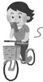
図1は、ながらスマホの事故によって救急車で運ばれた人の年毎の人数です。