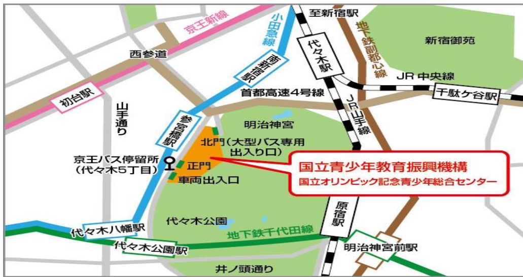
参宮橋からの【歩道橋】を使った経路