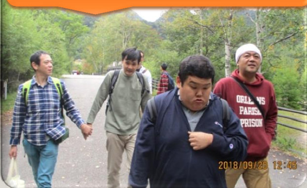
湯/湖の周りをハイキング!! (-_-) 空気が良くて気分爽快!!