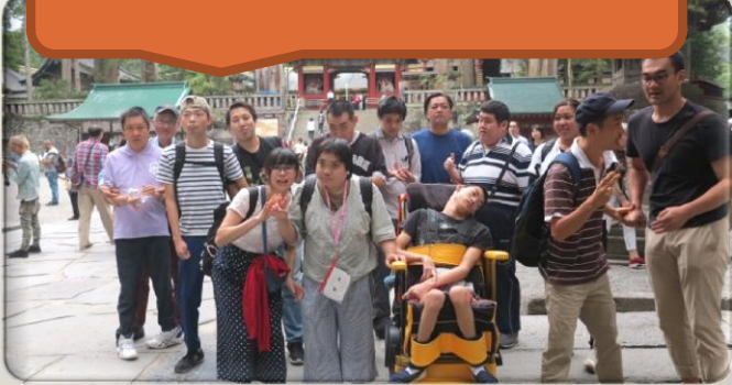
～日光東照宮の前で記念撮影～