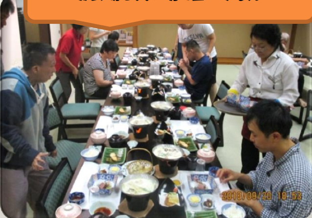
宴会場を貸し切り皆で夕食♪